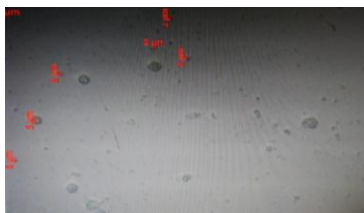
Gambar 1. Foto niosom (perbesar 40x) menggunakan mikroskop pada formula dengan Konsentrasi span 60:kolesterol (100:20 µmol)

Niosom multilamellar adalah niosom yang terdiri dari beberapa lapisan lipid bilayer (Kshitij et al. , 2013). Selain data ukuran partikel dari hasil analisis dengan PSA juga diperoleh data indeks polidispers (IP). Indeks polidispers menunjukkan distribusi ukuran partikel dimana rentang indeks polidispers berada diantara 0-1. Nilai indeks polidispers yang berada pada rentang dibawah 0,5 menunjukkan distribusi ukuran partikel yang homogen sedangkan nilai indeks polidispers yang melebihi 0,5 menunjukkan distribusi ukuran partikel yang heterogen (Avadi, 2010). Hasil indeks polidispers diperoleh sebesar 0,203 yang mana menunjukkan distribusi partikel yang homogen atau seragam.