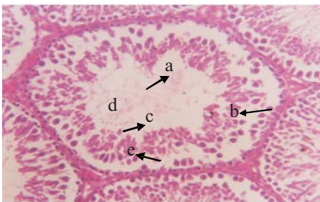
Gambar 2. Gambaran mikroskopik tubulus seminiferus testis kelompok FEAS-500. a. Lumen kosong berkurangnya spermatozoa b.spermatogonia c.spermatid d.spermatozoa e.sel sertoli

Pada Gambar 2 memperlihatkan hasil pemeriksaan histologi testis tikus yang diberi perlakuan FEAS-500, terjadi perubahan morfologi sel-sel testis, adanya nekrosis pada sel-sel pembentuk spermatozoa ditandai dengan berkurangnya spermatogonium, spermatid, dan spermatozoa. Lumen-lumen tubulus seminiferus kosong dengan spermatozoa. Hal ini menunjukkan adanya gangguan pada proses spermatozoa.