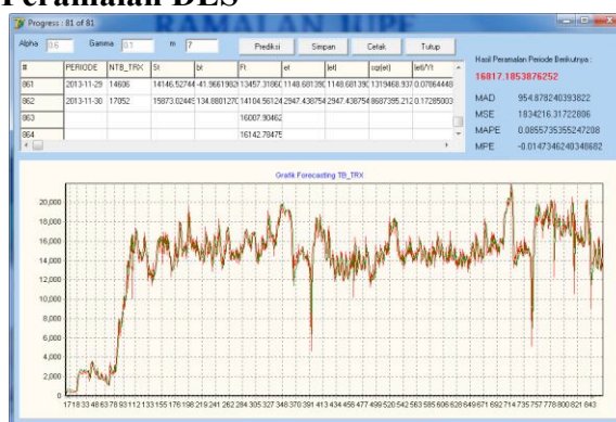
Gambar 4.4.5 : Form Peramalan DES

Double Exponential Smoothing (DES) merupakan salah satu metode peramalan untuk data dengan pola trend. Dalam peramalan ini membutuhkan dua parameter alpha dan gamma dalam menghitung hasil peramalan. Parameter ini berguna sebagai parameter untuk mendapatkan hasil peramalan dengan nilai galat minimum.