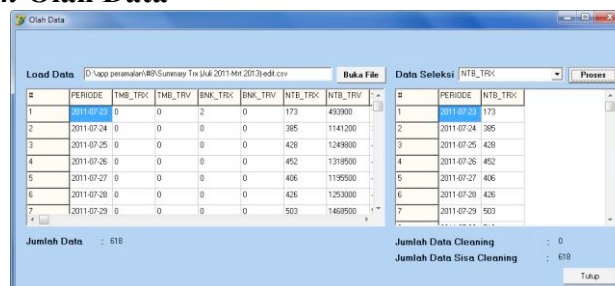
Gambar 4.4.2 : Form Olah Data

Pengambilan data dari file .csv memanfaatkan komponen memo untuk mempermudah pemindahan data. Pada file .csv , setiap field dipisah dengan delimiter (tanda koma) sehingga perlu adanya source code untuk memisahkan data agar dapat masuk pada tabel ( stringgrid ) yang disediakan.