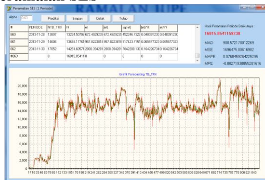
Gambar 4.4.4 : Form Peramalan SES

Single Exponential Smoothing (SES) merupakan salah satu metode peramalan untuk data dengan pola horizontal atau stasioner. Dalam peramalan ini membutuhkan satu parameter alpha dalam menghitung hasil peramalan. Parameter ini berguna sebagai parameter untuk mendapatkan hasil peramalan dengan nilai galat minimum.