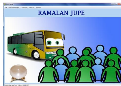
Gambar 4.4.1 : Form Utama Aplikasi Peramalan

Form utama merupakan induk dari sistem yang dibangun. Form tersebut berfungsi untuk mengakses menu-menu yang ada di dalam sistem.