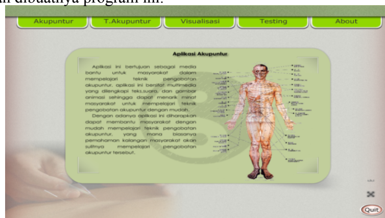
Gambar 1. Tampilan menu home

Menu home berisikan tentang pengertian akupuntur, manfaat dan tujuan dibuatnya program ini.