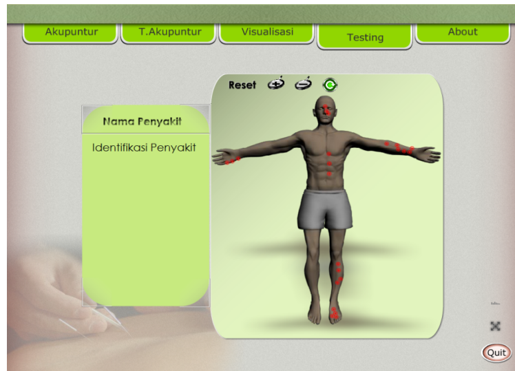
Gambar 4. Tampilan menu Testing

Menu testing berisi tentang animasi 3D gambar tubuh manusia beserta titik akupunturnya, yang mana user bisa menggunakan titik-titik tersebut sebagai percobaan test pengobatan akupuntur yang telah dipelajari dari menu visualisasi.