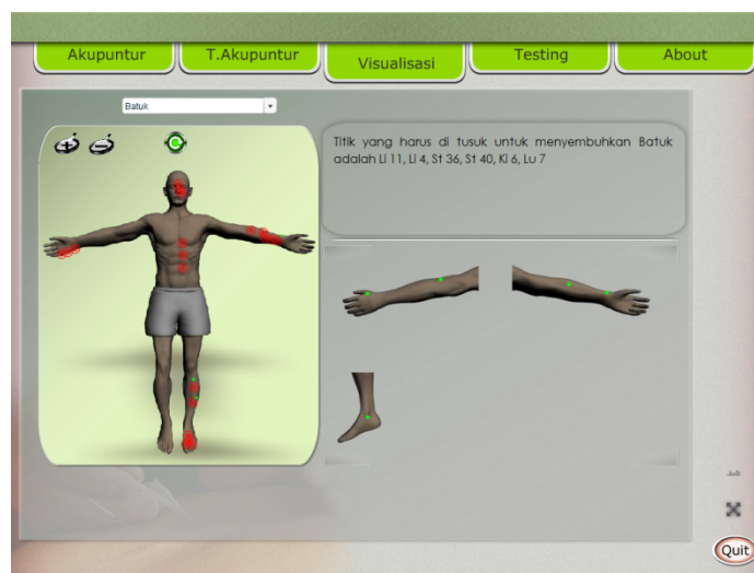
Gambar 3. Tampilan menu Visualisasi

Menu visualisasi berisi tentang visualisasi teknik pengobatan akupunktur, yang mana pada halaman terdapat beberapa objek seperti combo box yang berisikan nama penyakit, kemudian animasi 3D gambar tubuh manusia beserta titik akupunturnya.