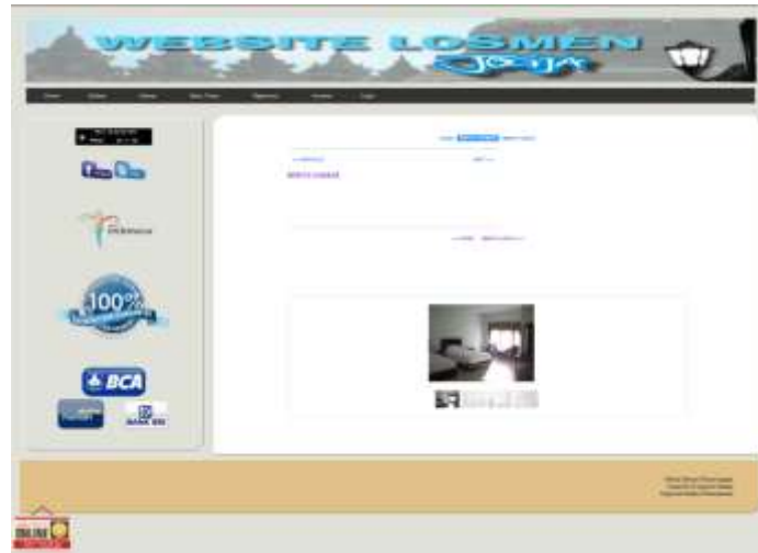
Gambar 3. Halaman indeks

Halaman index berisi sekilas tentang gambaran umum website dan menu-menu yang terdapat pada website . Setelah halaman indeks, akan ada halaman pilih kamar seperti ditunjukkan pada gambar 4.