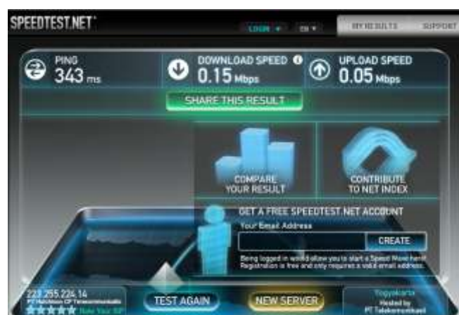
Gambar 13. Contoh pengukuran bandwidth pada speedtest.net

Pengukuran bandwidth pada www.speedtest.net dapat dilihat pada gambar 13 dibawah ini.