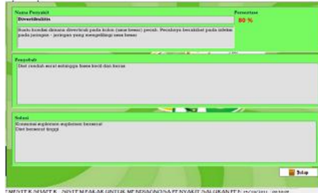
Gambar 3. Tampilan Form Detail Konsultasi

Selanjutnya user dapat melihat detail dari hasil konsultasi penyakit dengan cara mengklik nama penyakit hasil diagnosa. Pada form detail konsultasi berisi nama penyakit, definisi, persentase penyakit, penyebab dan solusi dari penyakit tersebut. Seperti pada Gambar 3. berikut ini: