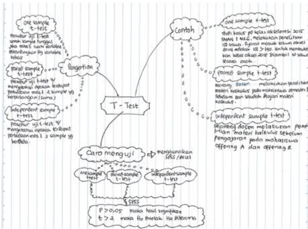
Gambar 1. Peta konsep kelompok 1 dengan dominan jaring (Net)

Gambar 1 menunjukkan salah satu contoh peta konsep yang menunjukkan komponen jaring yang dominan. Mahasiswa menggunakan simbol-simbol yang sesuai dengan ketertarikan pribadi serta simbol tertentu. Konsep uji t dikelompokkan berdasarkan pengertian, contoh, dan cara menguji jenis uji t tersebut.