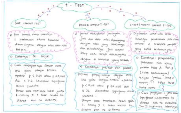
Gambar 3. Peta konsep kelompok 2 dengan jaring-daftar (Net-Chain)

Gambar 4 menunjukkan peta konsep dengan konsep jenis uji t sebagai pokok konsep utama. Mahasiswa menggunakan warna yang bervariasi dan model bentuk penulisan yang sesuai dengan kepribadiannya. Mahasiswa pada jenis ini masih menggunakan rangkaian konsep untuk memudahkan dalam belajar.