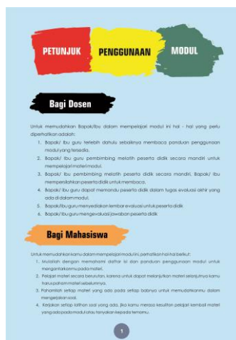
Gambar 3. Petunjuk Penggunaan Modul

Halaman ini berisi petunjuk bagaimana seharusnya penggunaan modul bangun ruang ini bagi dosen maupun bagi mahasiswa.