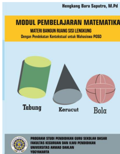
Gambar 2. Tampilan Cover Modul