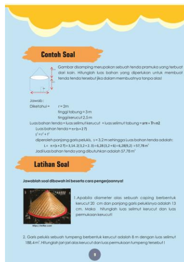
Gambar 5. Latihan soal dengan pendekatan kontekstual

Contoh soal dibuat untuk memberikan gambaran atau memudahkan mahasiswa dalam memahami dan menyelesaikan persoalan matematika yang terkait dengan materi yang disajikan dalam modul. Latihan soal merupakan soal yang harus dikerjakan oleh mahasiswa setelah belajar materi tertentu. Tujuan latihan soal ini agar mahasiswa benar-benar belajar secara aktif dan akhirnya menguasai konsep yang sedang dibahas dalam kegiatan belajar tersebut. Latihan yang disajikan disusun secara bervariasi berdasarkan tingkat kesulitannya serta disajikan dengan pendekatan kontekstual