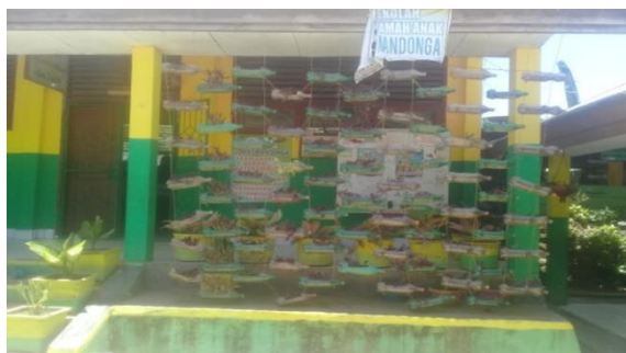
Gambar 2 Pemanfaatan LIPSTIK sebagai media Tanam

Observasi awal yang dilakukan menunjukkan bahwa LIPSTIK sejatinya telah dimanfaatkan oleh guru namun dalam bentuk yang berbeda. Sebagaimana ditemukan di setiap sekolah sample terdapat pemanfaatan LIPSTIK sebagai berikut: