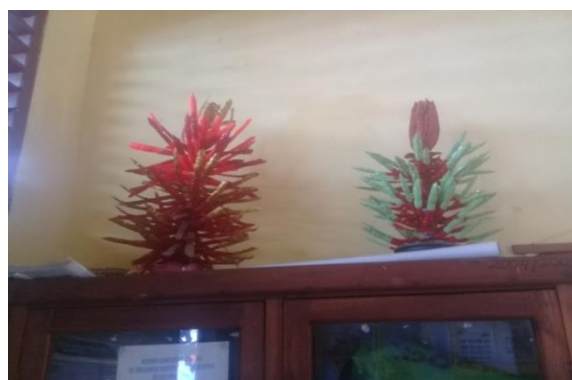
Gambar 3 Pemanfaatan LIPSTIK sebagai Hiasan Ruangan

Dari gambar 2 dan 3 menunjukkan bahwa guru pada Sekolah Dasar Negeri yang ada di Kota Kendari pada dasarnya memiliki kreatifitas dalam hal pengolahan dan pemanfaatan LIPSTIK namun dalam lingkup yang berbeda yaitu kerajinan tangan yang menghasilkan karya seni dan pajangan yang sangat menarik. Namun kurangnya pemahaman pentingnya dan ekonomisnya memanfaatkan LIPSTIK serta kurangnya inisiatif untuk membuat.