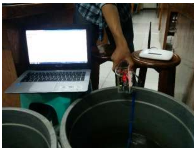
Gambar 5. Pengujian Keseluruhan

Proses pengujian keseluruhan dilakukan dengan cara mengisi air pada ember, air yang ada di ember dideteksi permukaannya oleh sensor ping ultrasonik , kemudian hasil dari pembacaan sensor ping ultrasonik ini akan di tampilkan pada web ditunjukkan Gambar 5.