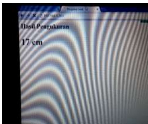
Gambar 4. Tampilan pada website

Dilakukan dengan cara menjauhkan prangkat penerima dari tpling dan hadwer seberapa jauh web dapat menerima data dari alat tinggi muka air berbasis web dan pengujian web ditunjukkan Gambar 4