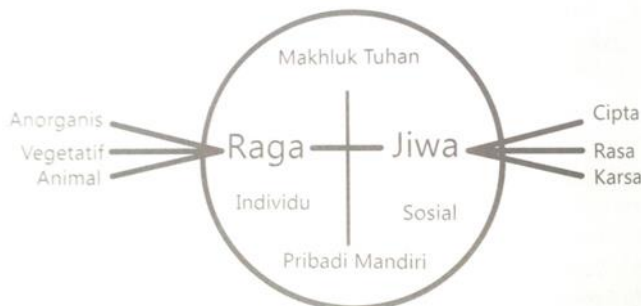
Gambar 2 Manusia Pancasila

Islam dan Indonesia terhubung oleh manusia yang merupakan umat Islam dan di saat yang sama juga sebagai warga negara Indonesia. Konsep manusia seperti itu secara komprehensif oleh Sunarjo Wreksosuhardjo digambarkan sebagai manusia Pancasila sebagai berikut.