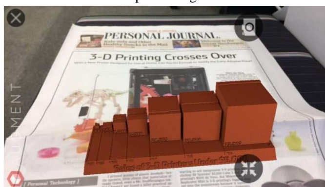
Gambar 1 AR pada Infografis