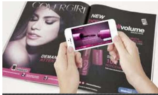
Gambar 2 Iklan AR dalam Media Cetak

ketersediaan produk (Pantano: 2017). Kelompok usia konsumen yang menerima AR dengan cepat adalah para anak muda. Dalam konteks pemasaran, pasar anak muda sangat strategis karena mereka mudah sekali beradaptasi dengan teknologi, akan menjadi konsumen dalam jangka waktu yang panjang, serta lebih terbuka akan perubahan trend yang diciptakan produsen. Untuk itu, media cetak seharusnya sudah menyediakan AR dalam iklan yang ada dalam dunia cetak. Tanpa mengikuti trend AR, pasar periklanan media cetak akan semakin meredup karena tidak bisa menyaingi iklan dalam dunia online.