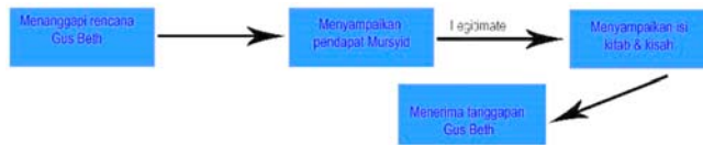
Gambar 2. Urutan tindakan K.H Mohan Assyakirriy episode jagongan politik materi larangan meminta jabatan politik

Putra Kedua menyatakan akan mengurungkan niatnya untuk mencalonkan diri menjadi anggota DPR RI 2019. Tindakan Putra Kedua mengurungkan niatnya untuk mencalonkan diri menjadi anggota DPR RI 2019 merupakan Regulative Rules yang dipengaruhi oleh kekuatan kausal dan logika deontik prohibited. Logika deontik prohibited merupakan sebuah tindakan yang disadari oleh seseorang untuk menghindari hal hal yang terlarang (Pawanteh, 1996).