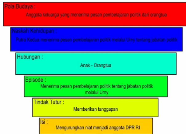
Gambar 7. Hierarki makna Putra Kedua episode menerima pesan tentang jabatan politik