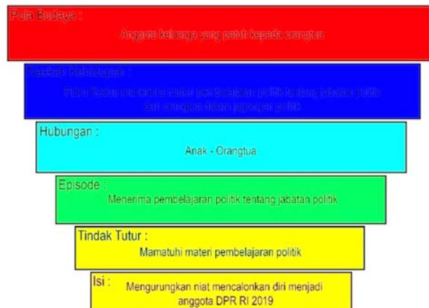
Gambar 3. Hierarki makna Putra Kedua episode menerima materi tentang jabatan politik

Putra Kedua menyatakan akan mengurungkan niatnya untuk mencalonkan diri menjadi anggota DPR RI 2019. Tindakan Putra Kedua mengurungkan niatnya untuk mencalonkan diri menjadi anggota DPR RI 2019 merupakan Regulative Rules yang dipengaruhi oleh kekuatan kausal dan logika deontik prohibited. Logika deontik prohibited merupakan sebuah tindakan yang disadari oleh seseorang untuk menghindari hal hal yang terlarang (Pawanteh, 1996).