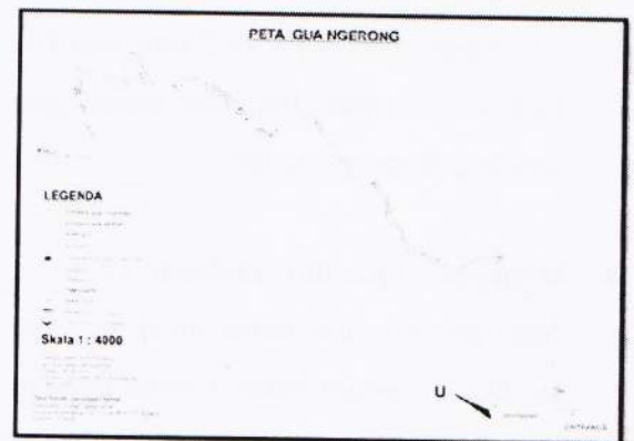
Gambar 3. Peta Gua Ngerong

Diversity Index sebesar 0,76. Diversitas yang tinggi berbanding lurus dengan panjang lorong gua Ngerong yang mencapai 1.800 m. Lorong gua Ngerong merupakan lorong terpanjang diantara-gua-gua yang berada di kawasan karst Tuban. Hal ini sama dengan yang diungkapkan Arita (1996), yang menyatakan bahwa semakin panjang lorong gua akan semakin beragam kelelawar yang dijumpai.