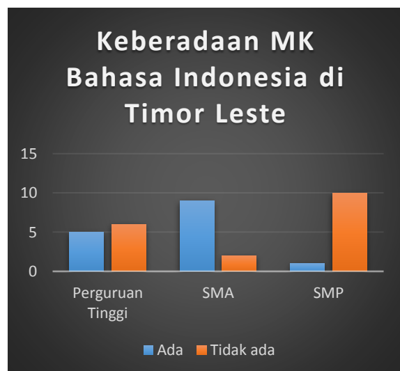
Gambar 2. Kedudukan mata kuliah Bahasa Indonesia di Timor Leste

Dapat dicermati pada tabel I bahwa terdapat 11 institusi di Timor Leste yang mengajarkan bahasa Indonesia di institusi-institusi tersebut. Dari sebelas institusi tersebut, satu institusi merupakan milik pemerintah Indonesia (PBI), dua institusi dalam bentuk pendidikan tinggi (universitas) dan sisanya dalam bentuk pendidikan menengah. Tidak seperti institusi pendidikan lainnya, Universida de Dili (UNDIL) mulai membuka mata kuliah bahasa Indonesia untuk mahasiswa mereka pada tahun 2018.