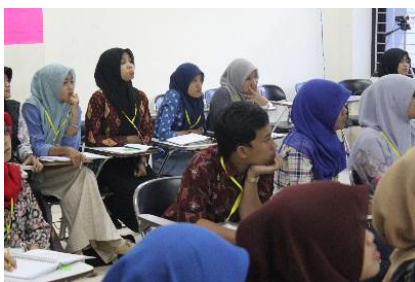
Gambar 7. Potret keaktifan mahasiswa dalam proses pembelajaran dilihat dari indikator mendengar dan melihat