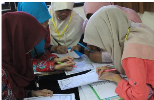
Gambar 3. Mahasiswa melakukan data collection atas masalah yang mereka hadapi dari catatan dan uji coba secara berkelompok

Ketika eksplorasi berlangsung dosen juga memberi kesempatan kepada mahasiswa untuk mengumpulkan informasi sebanyak-banyaknya yang relevan untuk membuktikan benar atau tidaknya hipotesis (Syah, 2004:244). Pada tahap ini berfungsi untuk menjawab pertanyaan atau membuktikan benar tidaknya hipotesis.