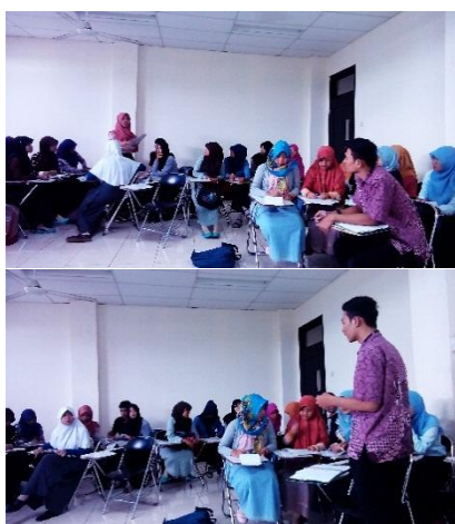
Gambar 5. Pembuktian dilakukan dengan cara proses mempresentasikan hasil diskusi dan memproses tanggapan dari kelompok lain

Pada tahap ini siswa melakukan pemeriksaan secara cermat untuk membuktikan benar atau tidaknya hipotesis yang ditetapkan tadi dengan temuan alternatif, dihubungkan dengan hasil data processing (Syah, 2004:244). Verification menurut Bruner, bertujuan agar proses belajar akan berjalan dengan baik dan kreatif jika guru memberikan kesempatan kepada siswa untuk menemukan suatu konsep, teori, aturan atau pemahaman melalui contoh-contoh yang ia jumpai dalam kehidupannya.