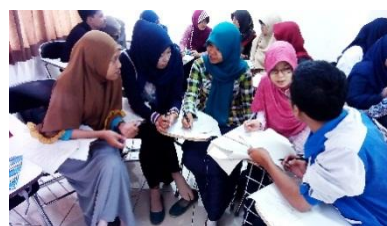
Gambar 8. Mahasiswa melakukan proses berpikir dengan mengungkapkan ide dan gagasan di depan kelas maupun dengan anggota kelompoknya