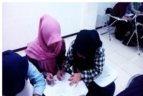
Gambar 2. Dosen memberikan lembar kerja mahasiswa (LKM) sebagai bahan untuk mengidentifikasi masalah pada pokok bahasan terkait

Setelah dilakukan stimulasi langkah selanjutnya adalah dosen memberi kesempatan kepada mahasiswa untuk mengidentifikasi sebanyak mungkin agenda-agenda masalah yang relevan dengan bahan pelajaran, kemudian salah satunya dipilih dan dirumuskan dalam bentuk hipotesis (jawaban sementara atas pertanyaan masalah), sedangkan menurut permasalahan yang dipilih itu selanjutnya harus dirumuskan dalam bentuk pertanyaan, atau hipotesis, yakni pernyataan (statement) sebagai jawaban sementara atas pertanyaan yang diajukan.