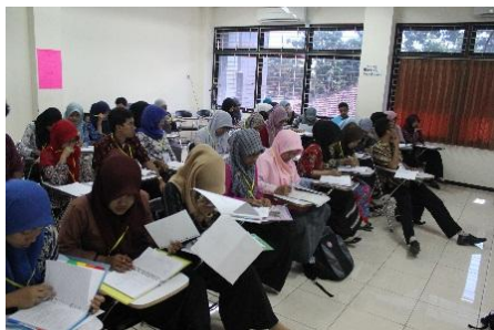
Gambar 9. Proses pengorganisasian pikiran mahasiswa dilaksanakan dan dinilai pada proses latihan