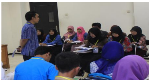
Gambar 1. Dosen memberikan pertanyaan di awal perkuliahan sebagai dasar pemberian rangsangan pada mahasiswa

Pertama-tama pada tahap ini mahasiswa dihadapkan pada sesuatu yang menimbulkan kebingungannya, kemudian dilanjutkan untuk tidak memberi generalisasi, agar timbul keinginan untuk menyelidiki sendiri. Disamping itu guru dapat memulai kegiatan perkuliahan dengan mengajukan pertanyaan, anjuran membaca buku, dan aktivitas belajar lainnya yang mengarah pada persiapan pemecahan masalah.