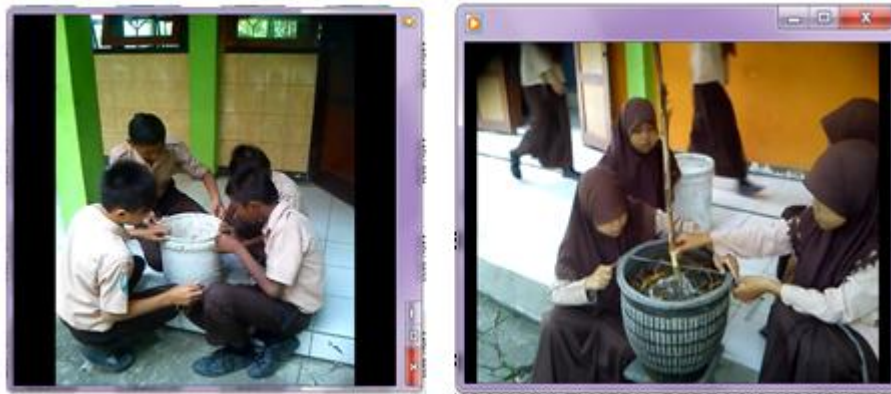
Gambar 1. Mengukur Keliling dan diameter benda berbentuk lingkaran