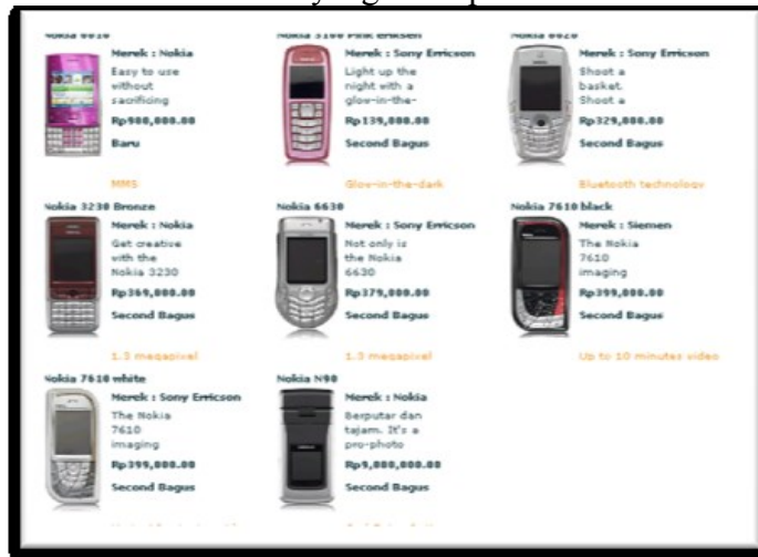
Gambar 3. Tampilan katalog produk pada bagian presentation

Pengujian dilakukan dengan mengecek data katalog produk yang tersimpan di database dan data yang ditampilkan.